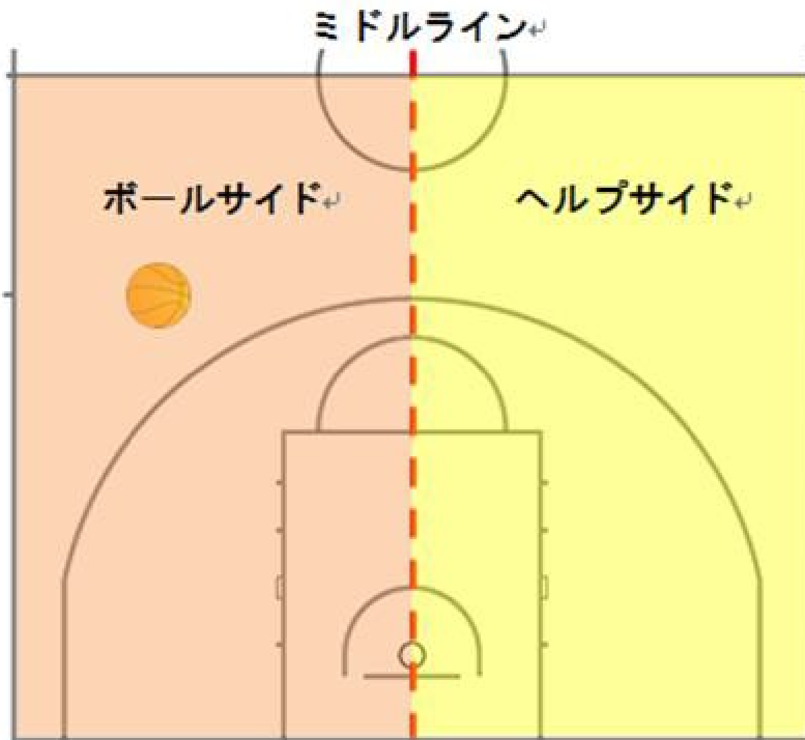
【図 2】ミドルラインとボールサイド・ヘルプサイド